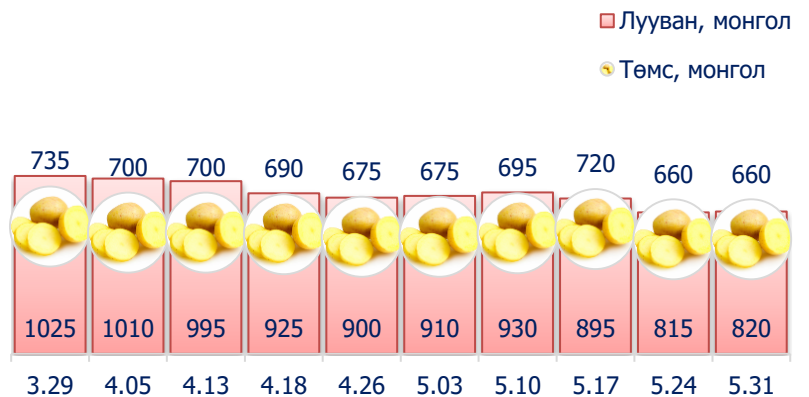
Зураг 5. Нэг кг хүнсний ногооны дундаж үнэ, төгрөг

2017 оны 5-р сарын 5-р долоо хоногт өмнөх долоо хоногтой харьцуулахад монгол лууван 0.6 хувиар буюу 5 төгрөгөөр өсч, харин байцаа 10.6 хувиар буюу 180 төгрөг, хүрэн манжин 10.9 хувиар буюу 290 төгрөгөөр тус тус буурсан байна.