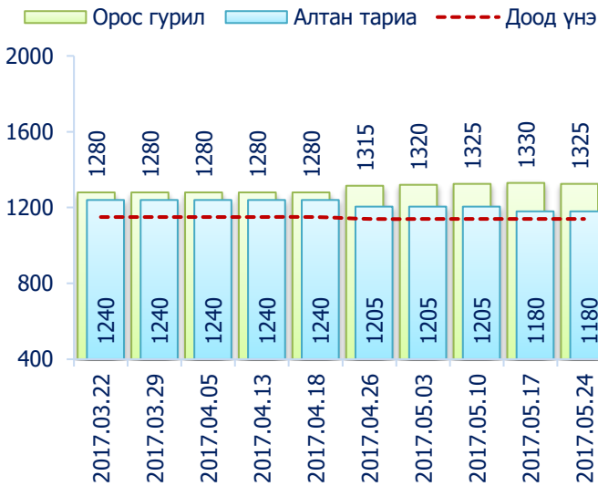
Зураг 3. Дээд зэргийн 1 кг гурилын үнэ, төгрөг