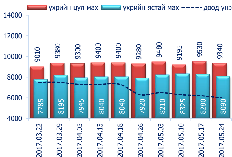
Зураг 1. Үхрийн 1 кг махны дундаж үнэ, төгрөг

2017 оны 5-р сарын 4-р долоо хоногт хонины ястай нэг килограмм мах дунджаар 7200 төгрөг, үхрийн ястай мах нэг килограмм нь дунджаар 8090 төгрөгийн үнэтэй байна. Үхрийн ястай махны үнэ өмнөх долоо хоногтой харьцуулахад 2.3 хувиар буюу 190 төгрөг, үхрийн цул махны үнэ 2.0 хувиар буюу 190 төгрөгөөр тус тус буурчээ. Энэ 7 хоногийн ажиглалтаар үхрийн мах "Хархорин" хүнсний захад хамгийн хямд буюу 6000 төгрөг, харин "Меркури" хүнсний захад хамгийн өндөр үнэтэй буюу 10000 төгрөг байна.