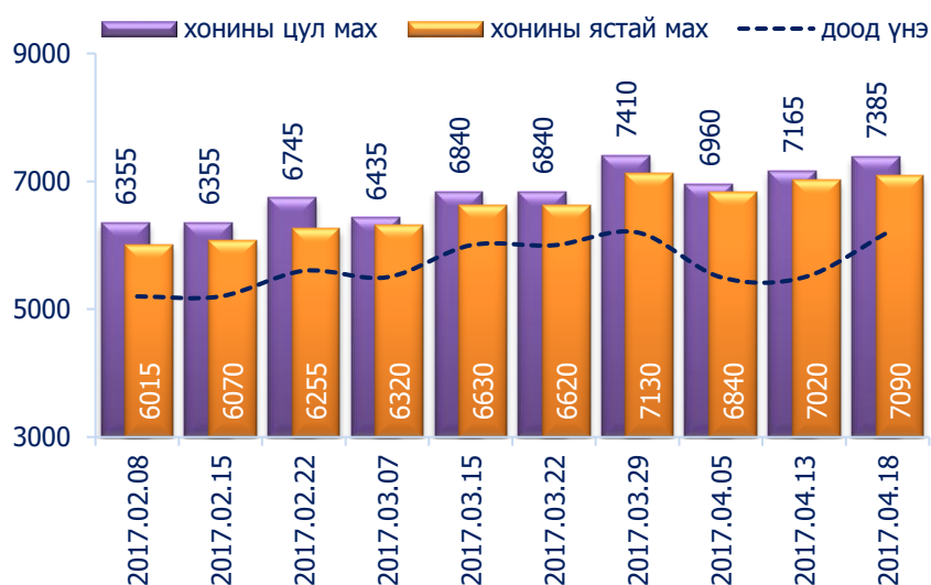
Зураг 2. Хонины 1 кг махны дундаж үнэ, төгрөг

Хонины ястай махны үнэ өмнөх долоо хоногтой харьцуулахад 1.0 хувиар буюу 70 төгрөгөөр, хонины цул махны үнэ 3.1 хувиар буюу 220 төгрөгөөр тус тус өссөн байна. Энэ долоо хоногийн ажиглалтаар хонины мах "Хархорин" хүнсний захад хамгийн хямд буюу 6200 төгрөгөөр, харин "Меркури", "Таван-Эрдэнэ" хүнсний захуудад хамгийн өндөр үнэтэй буюу 8000 төгрөгөөр худалдаалж байна.