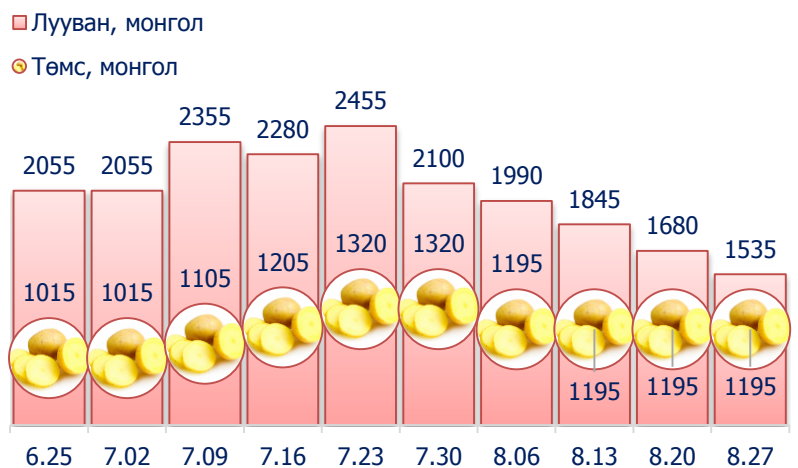
Зураг 5. Нэг кг хүнсний ногооны дундаж үнэ, төгрөг

2014 оны 8-р сарын 4-р долоо хоногт өмнөх долоо хоногтой харьцуулахад монгол лууван 8.6 хувиар буюу 145 төгрөгөөр, манжин 9.7 хувиар буюу 165 төгрөгөөр буурсан байлаа.