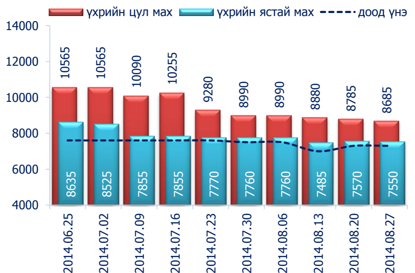
Зураг 1. Үхрийн 1 кг махны дундаж үнэ, төгрөг

2014 оны 8-р сарын 4-р долоо хоногт хонины ястай нэг килограмм мах дунджаар 6495 төгрөг, үхрийн ястай мах нэг килограмм нь дунджаар 7550 төгрөгийн үнэтэй байна. Үхрийн ястай махны үнэ өмнөх долоо хоногтой харьцуулахад 0.3 хувиар буюу 20 төгрөгөөр, үхрийн цул мах 1.1 хувиар буюу 100 төгрөгөөр буурсан байлаа. Энэ 7 хоногийн ажиглалтаар үхрийн мах "Хүчит Шонхор" хүнсний захад хамгийн хямд буюу 7300 төгрөг, "Номин" супермаркетад хамгийн өндөр үнэтэй буюу 9800 төгрөг байв.