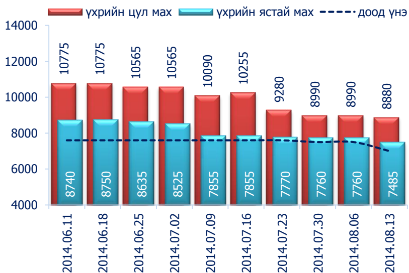
Зураг 1. Үхрийн 1 кг махны дундаж үнэ, төгрөг

2014 оны 8-р сарын 2-р долоо хоногт хонины ястай нэг килограмм мах дунджаар 6635 төгрөг, үхрийн ястай мах нэг килограмм нь дунджаар 7485 төгрөгийн үнэтэй байна. Үхрийн ястай махны үнэ өмнөх долоо хоногтой харьцуулахад 3.5 хувиар буюу 275 төгрөгөөр, үхрийн цул мах 1.2 хувиар буюу 110 төгрөгөөр буурсан байлаа. Энэ 7 хоногийн ажиглалтаар үхрийн мах "Хүчит Шонхор" хүнсний захад хамгийн хямд буюу 7000 төгрөг, "Номин" супермаркетэд хамгийн өндөр үнэтэй буюу 9800 төгрөг байв.