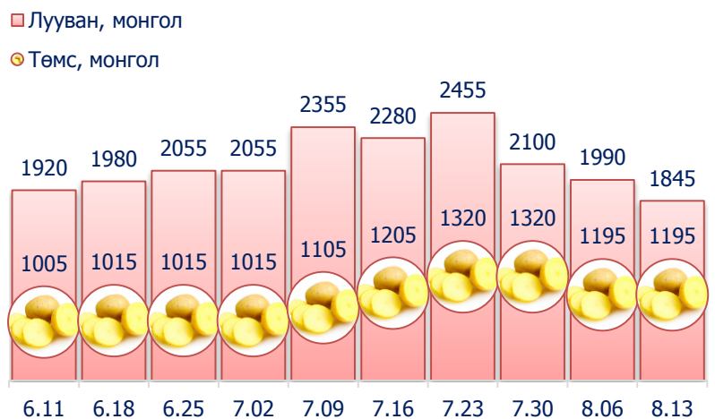
Зураг 5. Нэг кг хүнсний ногооны дундаж үнэ, төгрөг

2014 оны 8-р сарын 2-р долоо хоногт өмнөх долоо хоногтой харьцуулахад монгол лууван 7.3 хувиар буюу 145 төгрөгөөр буурч, харин байцаа 2.9 хувиар буюу 35 төгрөгөөр өссөн байлаа.