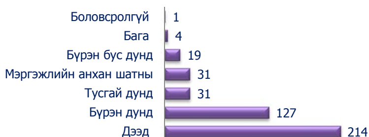
Зураг 11. Бүртгэлтэй ажилгүй иргэд /боловсролоор/

2014 оны 10 сарын байдлаар ажил идэвхтэй хайж байгаа ажилгүй иргэдийг боловсролын түвшингээр ангилж үзэхэд 50.1 хувийг дээд, 7.3 хувийг тусгай дунд болон мэргэжлийн анхан шатны, 29.7 хувийг бүрэн дунд, 4.4 хувийг бүрэн бус дунд, 0.9 хувийг бага боловсролтой 0.2 хувийг боловсролгүй ажилгүй иргэд эзэлж байна.