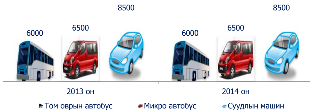
Зураг 14. Хот хоорондын зорчигч тээврийн үнэ /УБ-БН, БН-УБ/

2014 оны 10-р сард түлш, шатахууны үнэ тогтвортой байсан бөгөөд өнгөрсөн оны мөн үеэс төрөл тус бүр литр тутамдаа 40 төгрөгөөр буюу 2.2 - 2.6 хувиар тус тус өссөн байна.