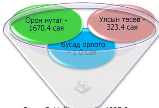
Зураг 5. Нийт орлого - 1995.0 сая төгрөг

НИЙГМИЙН ХАЛАМЖ: 2014 оны эхний 10 сарын байдлаар нийгмийн халамжийн сангийн 16.2 хувь буюу 323.4 сая төгрөг улсын төсвийн, 83.7 хувь буюу 1670.4 сая төгрөг орон нутгийн төсвийн, 0.1 хувь буюу 1.0 сая төгрөг бусад орлогоор санхүүжигдсэн байна.