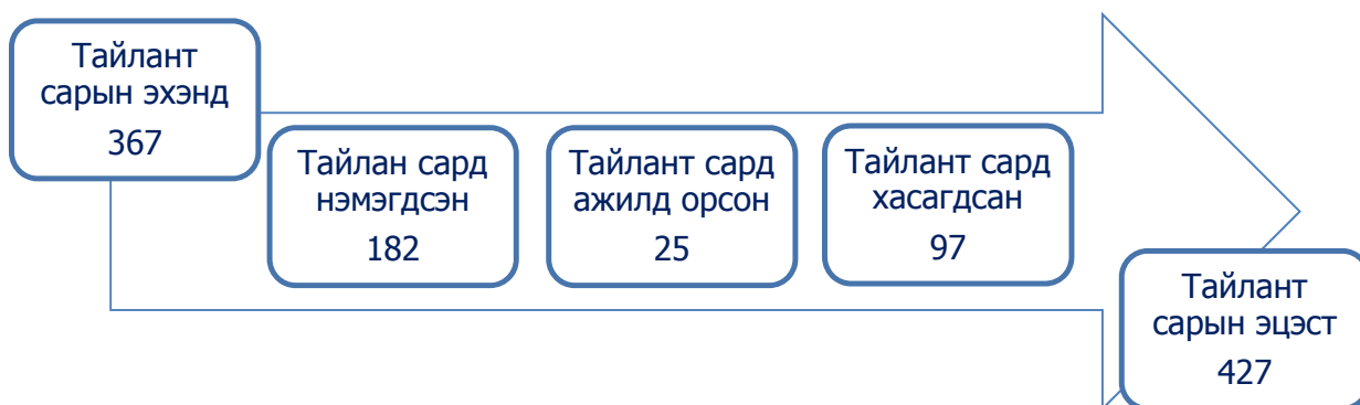
Зураг 10. Бүртгэлтэй ажилгүй иргэдийн хөдөлгөөн

Тайлант сард ажил идэвхтэй хайж байгаа 182 иргэн шинээр бүртгүүлсэн бөгөөд үүний 68.7 хувь нь буюу 125 нь эмэгтэйчүүд байна. Мөн энэ хугацаанд 25 иргэн ажилд зуучлуулан орсон байна.