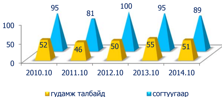
Зураг 10. Согтуугаар болон гудамж талбайд үйлдэгдсэн гэмт хэрэг

2014 оны эхний 10 сарын байдлаар согтуугаар үйлдэгдсэн гэмт хэрэг 89 байгаа нь өнгөрсөн оны мөн үеэс 6.3 хувиар буюу 6 хэргээр буурсан байна. Энэ нь тайлант хугацаанд бүртгэгдсэн хэргийн 44.5 хувийг эзэлж байгаа бөгөөд өнгөрсөн оны мөн үеэс 4.4 пунктээр нэмэгдсэн байна.