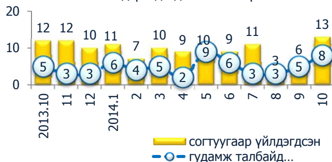
Зураг 8. Сogтуугаар болон гудамж талбайд үйлдэгдсэн гэмт хэрэг

Тайлант хугацаанд хүн амины хэрэг, залилан, булаалт болон гал түймрийн хэргүүд бүртгэгдээгүй байна. Малын хулгайн хэрэг 2 бүртгэгдсэн нь нийт хулгайн гэмт хэргийн 6.7 хувийг эзэлж байна.