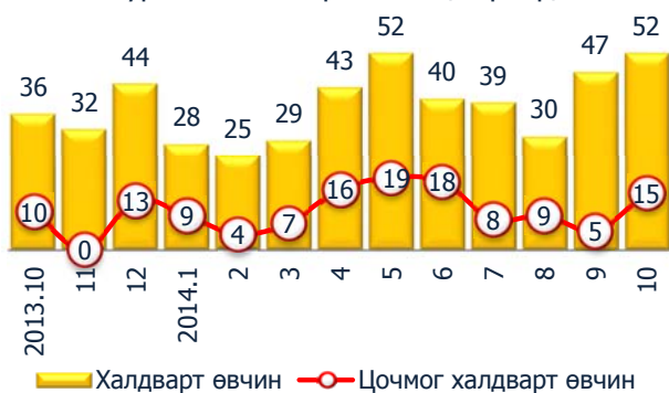
Зураг 7. Халдварт өвчин /сараар/

Энэ оны эхний 10 сарын байдлаар халдварт өвчний 385 тохиолдол гарсан нь өнгөрсөн оны мөн үеэс 78 тохиолдлоор буюу 16.8 хувиар буурсан байна. Дүүргийн дунджаар 10000 хүн тутамд ногдох халдварт өвчнөөр өвчлөгсдийн тоо 141.4 продицимель болсон нь өнгөрсөн оны мөн үеийнхээс 30.5 пунктээр буурсан байна.