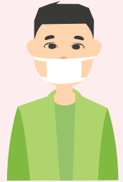
Халдварт өвчнөөр өвчилсөн хүний тоо