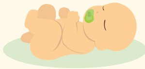
Төрсөн хүүхдийн тоо