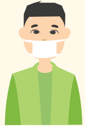
Халдварт өвчнөөр өвчилсөн хүний тоо