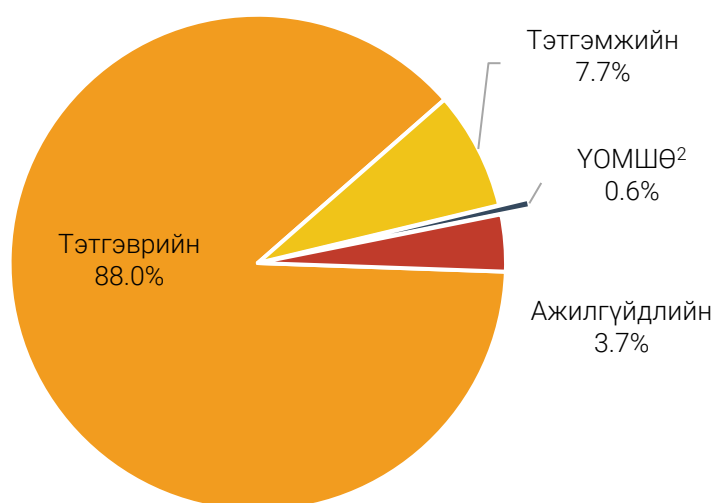
ЗУРАГ 2. ДААТГАЛЫН САНГИЙН ЗАРЛАГА, дүнд эзлэх хувиар, 2022 оны эхний 10 дугаар сарын байдлаар

Нийгмийн даатгалын сангаас 2022 оны 10 дугаар сарын байдлаар даатгуулагч иргэдэд 210.9 тэрбум төгрөгийг тэтгэвэр, тэтгэмж, төлбөр, тусламж, үйлчилгээний зардалд зарцуулжээ. Энэ нь өмнөх оны мөн үетэй харьцуулахад 41.8 (24.7%) тэрбум төгрөгөөр өссөн байна. Нийт зардлын 88.0 хувийг тэтгэврийн, 0.6 хувийг ҮОМШӨ-ний, 7.7 хувийг тэтгэмжийн, 3.7 хувийг ажилгүйдлийн даатгалын сангаас олгосон зардал эзэлж байна.