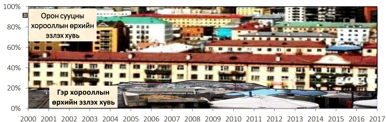
Зураг 1. Баянгол дүүргийн өрх, хорооллоор

Сүүлийн жилүүдэд орон сууцны барилгууд нэмэгдэж 2012 оноос орон сууцны хорооллын өрхийн тоо 10 шахам мянган өрхөөр нэмэгдсэн. 2017 оны байдлаар Баянгол дүүргийн нийт өрхийн 79.7 хувь нь орон сууцны хороололд, 20.3 хувь нь гэр хороололд оршин сууж байна.