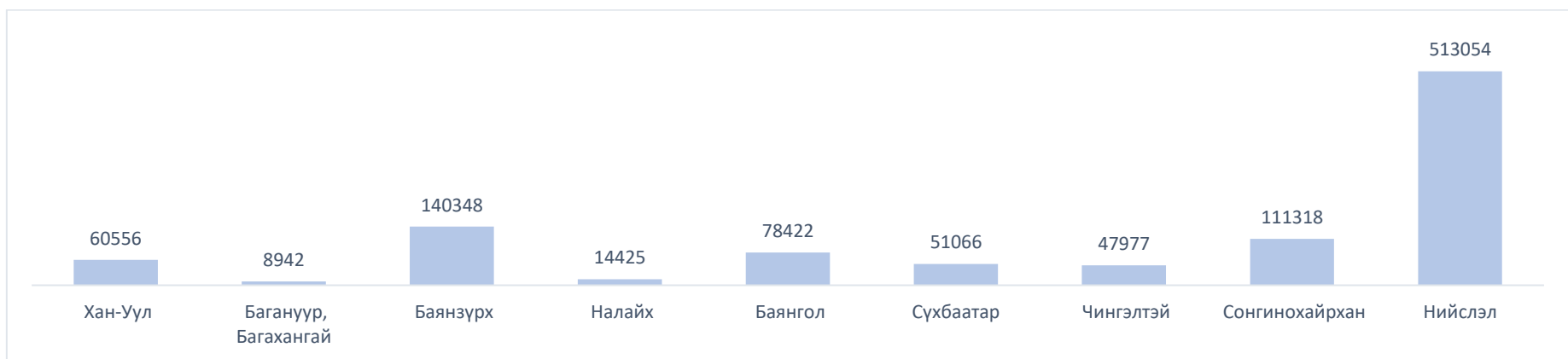
График 1. Ажиллагчдын тоо, дүүргээр