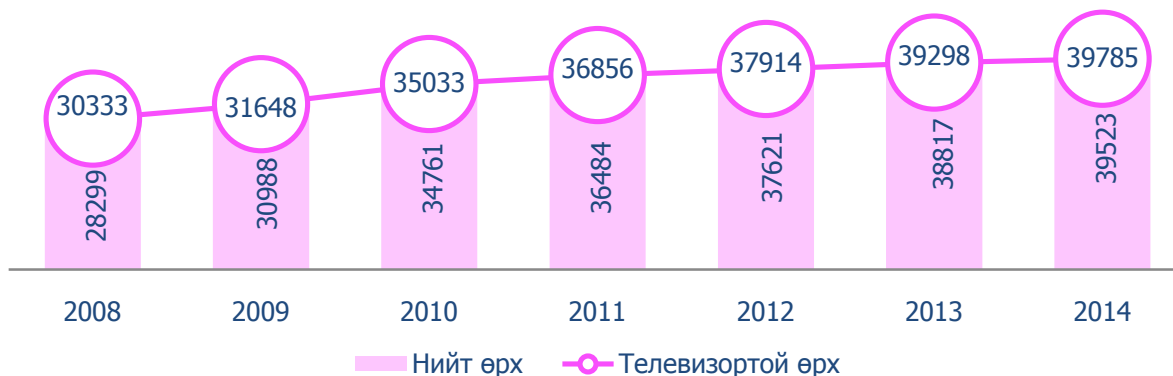
Зураг 1. Чингэлтэй дүүргийн телевизортой өрх

Дүүргийн нийт өрхийн 38.7 хувь нь компьютертэй бол компьютертэй өрхийн 44.9 хувь нь интернэт тогтмол ашигладаг байна. Нийт 14640 өрх 15402 ширхэг компьютер ашиглаж байна. Үүнээс зөврийн компьютер 4093 байна.