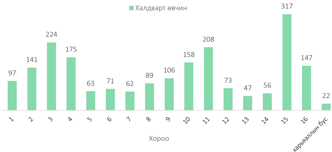
Зураг 2. Халдварт өвчин, хороогоор 2018 он

2018 онд халдварт өвчнөөр өвчлөгчдийн 317 нь (15.4%) 15-р хороонд, 224 нь (10.9%) 3-р хороонд, 208 нь (10.1%) 11-р хороонд, 175 нь (8.5%) 4-р хороонд, 158 нь (7.7%) 10-р хороонд, 147 нь (7.1%) 16-р хороонд, 141 нь (6.9%) 2-р хороонд, 106 нь (5.2%) 9-р хороонд, 580 нь (28.2%) бусад хороонд бүртгэгдсэн байна.