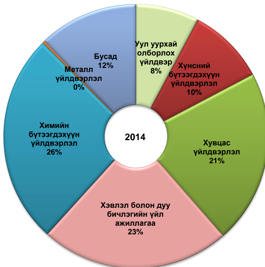
Хүснэгт 6. Аж үйлдвэрийн борлуулалт, салбараар, сая.төг, 2013, 2014 он